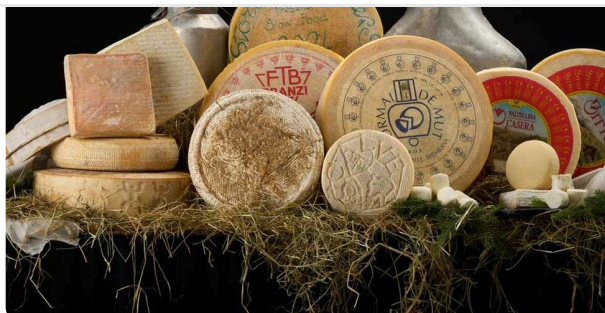
I formaggi bergamaschi a Forme