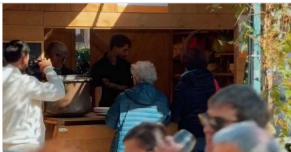
Gli stand di Forme