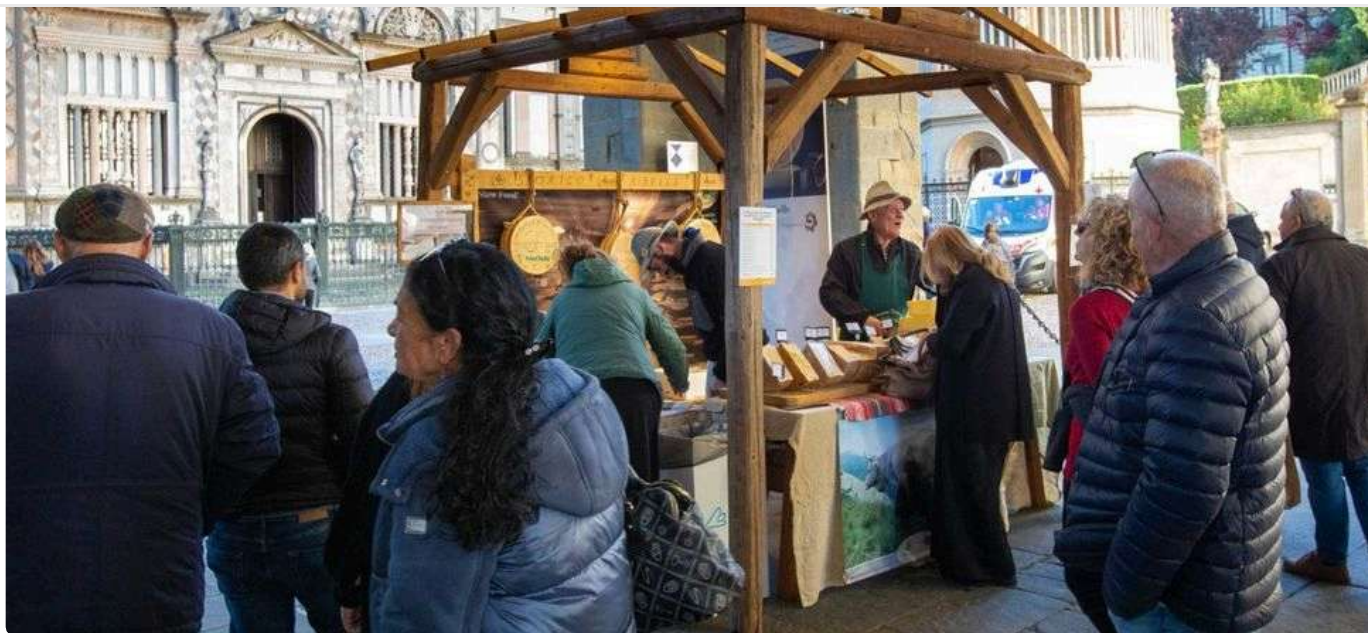
Durante Forme, in Città Alta